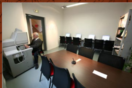
Salle de lecture

Un lecteur reproducteur de microfilms est toujours à votre disposition pour le prêt de microfilms entre service d'archives.