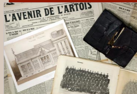
Dons aux Archives municipales

La promotion des richesses du patrimoine se traduit par l'organisation d'expositions, la sortie de publications... pour que les archives fassent partager l'Histoire.