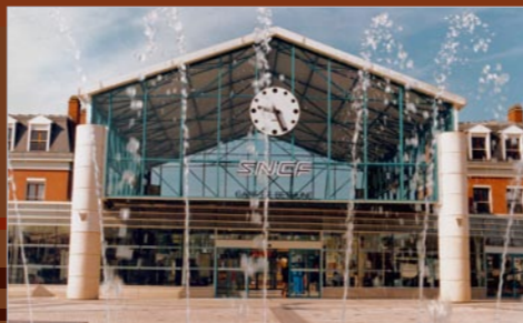
Gare de Béthune

Un lecteur reproducteur de microfilms est toujours à votre disposition pour le prêt de microfilms entre service d'archives.