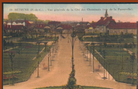
La cité des cheminots dans les années 1920