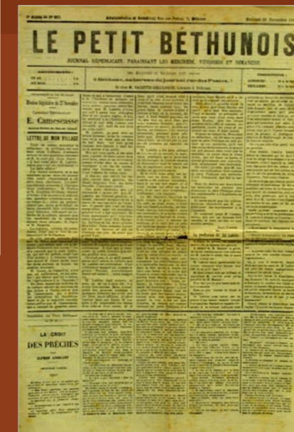
Le petit Bethunois