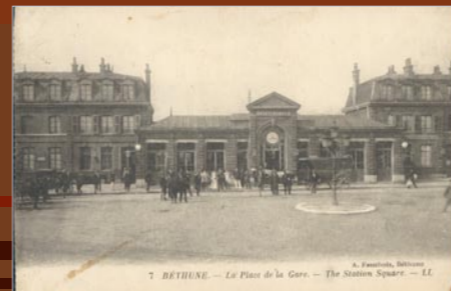
Gare de Béthune dans les années 1920