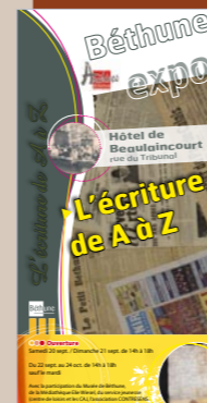
Affiche d'exposition, 2005