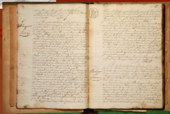
3E40, registre de mariage en 1832

« Les archives sont l'ensemble des documents quels que soient leur date, leur lieu de conservation, leur forme et leur support, produits ou reçus par toute personne physique ou morale et par tout service public ou privé dans l'exercice de leur activité »