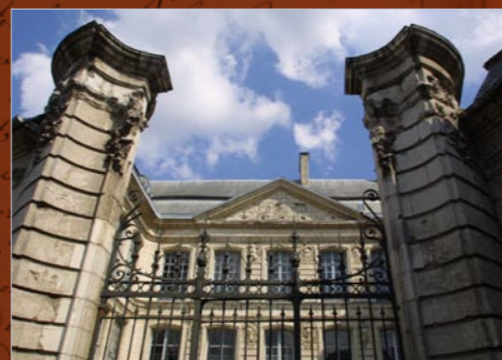
Hôtel de Beaulaincourt