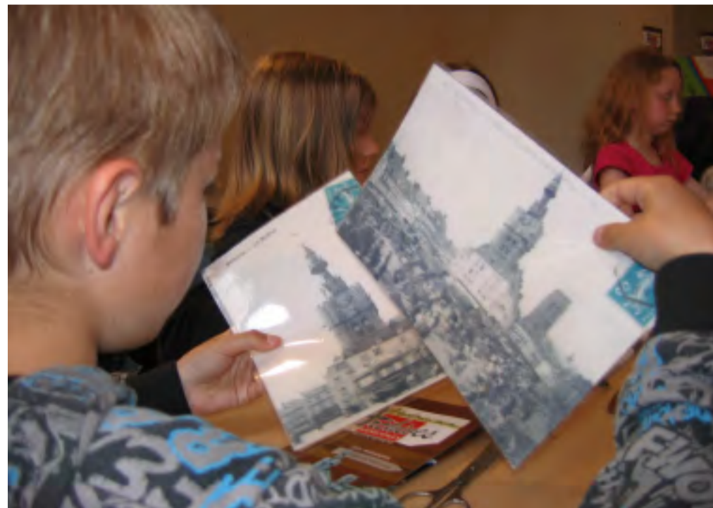
Le beffroi de Béthune a suscité de nombreuses interrogations

C'est maintenant le moment d'enfiler son armure afin de se plonger dans l'Héraldique. Avec une impatience perceptible, notre petit groupe s'initie et s'approprie un nouveau vocabulaire et une technique de conception assez singulière. Le temps d'un rappel historique et d'une série de questions-réponses, les enfants, munis de paires de ciseaux, de colle et de papiers de couleurs confection-