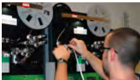
La société parisienne Forever a numérisé les films

Les films dormaient depuis longtemps entre deux tablettes de rayonnages. Ces bandes étaient-elles encore en bon état ? Était-il intéressant de les conserver pour l'histoire de la ville ?