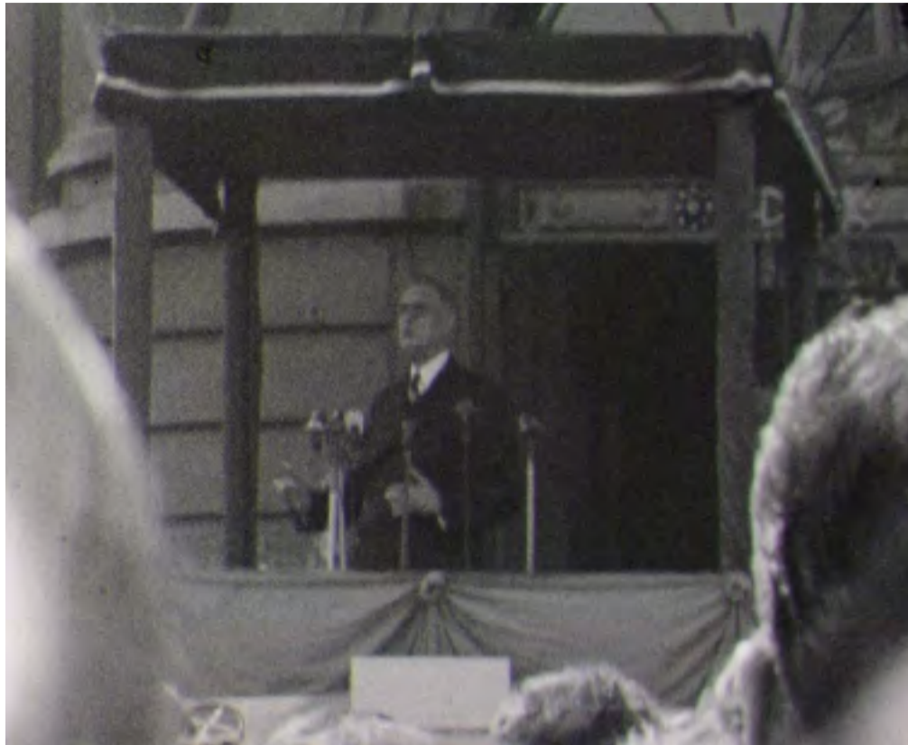
Extrait du film « le Général de Gaulle à Béthune ». 7AVI

« Un patrimoine accessible à tous »... le thème des journées du patrimoine 2009 a inspiré les archivistes. En