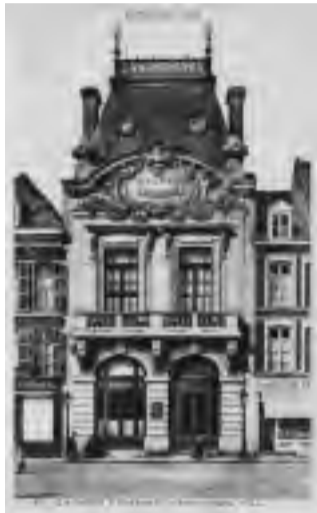
La Caisse d'épargne