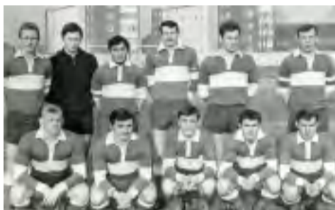
L'équipe du Stade Béthunois en 1968

lecture actuel pour permettre au grand public de les visualiser. Quelle ne fut pas notre surprise lorsque nous avons découvert le contenu de ces films, après plusieurs semaines d'attente. Au bout de ces semaines de suspense, nous avons rendez-vous avec l'histoire... et quelle histoire : le Général de