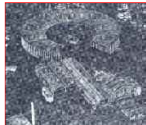
La Rotonde, une ancienne friche industrielle

Ce bâtiment à l'architecture imposante témoigne de l'activité ferroviaire présente dans la cité de Buridan. Une activité dont l'histoire remonte au 19 e siècle avec le déve-