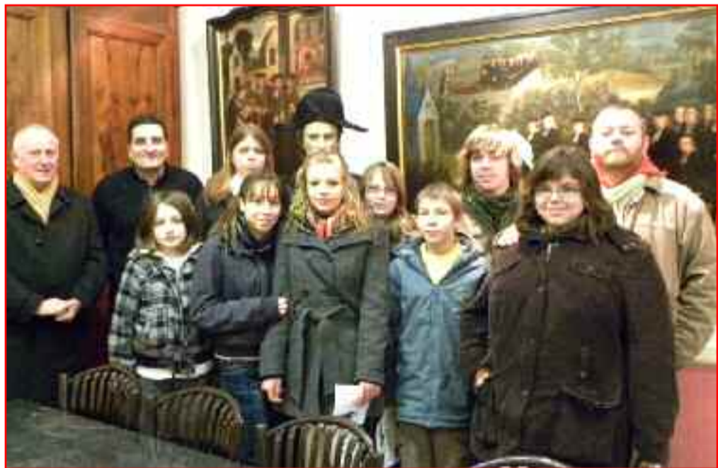
A la découverte de l'univers de la confrérie des Charitables

Des monuments ont été présentés mais aussi un lieu symbolique et incontournable : la Grand Place. Sans entrer dans les détails architecturaux, nous avons évoqué les grands hommes qui ont foulé le sol de la place : de Louis XVIII à François Mitterrand en passant par le Général de Gaulle. Et pourquoi l'appellation Grand Place ? Parce que le conseil municipal du 30 novembre 1944 en a décidé ainsi. Une délibération de 1944 que ces jeunes ont pu découvrir. Pour finir en beauté, un petit jeu a été organisé pour nos historiens en herbe. Découvrir l'actuelle Grand Place avec un plan du cadastre napoléonien du 19 e siècle. Surprenant pour ces